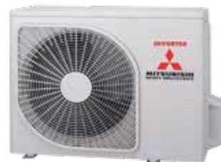
SRC45ZSP-W SRC 50 ZSP-W